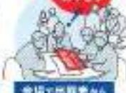
FOODEX Navi 6.5