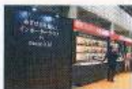
協力: ディオニス株式会社

海外食品取扱実績を誇る輸入のプロフェッショナルが、サンプル発注や海外への発注、輸送手配などの「輸入代行業務」のご相談に応じます。