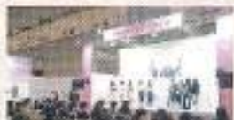
11ホール:ウェルネスステージ